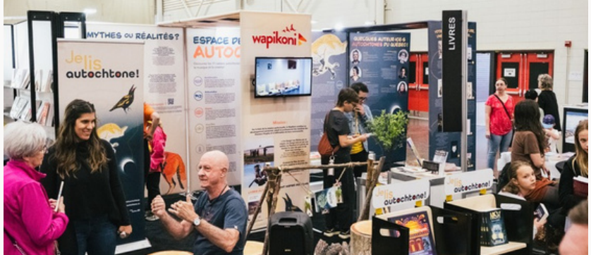
Espace découverte « Je lis autochtone ».